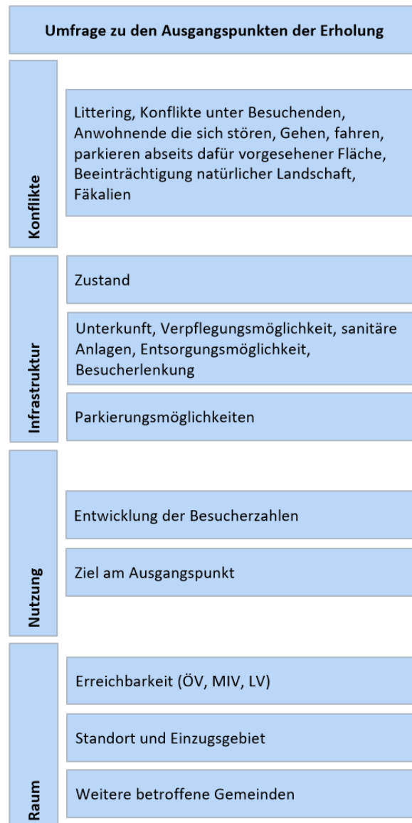
Abbildung 1: Aufbau und Themen des Fragebogens für die Gemeinden